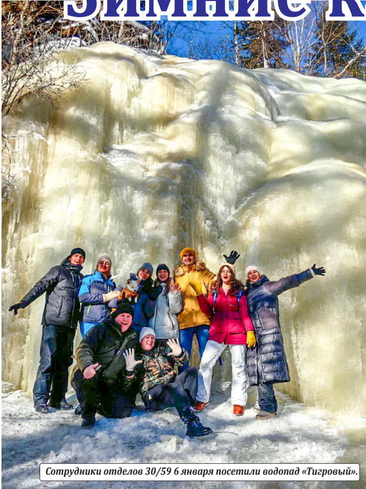
Сотрудники отделов 30/59 6 января посетили водопад «Тигровый».