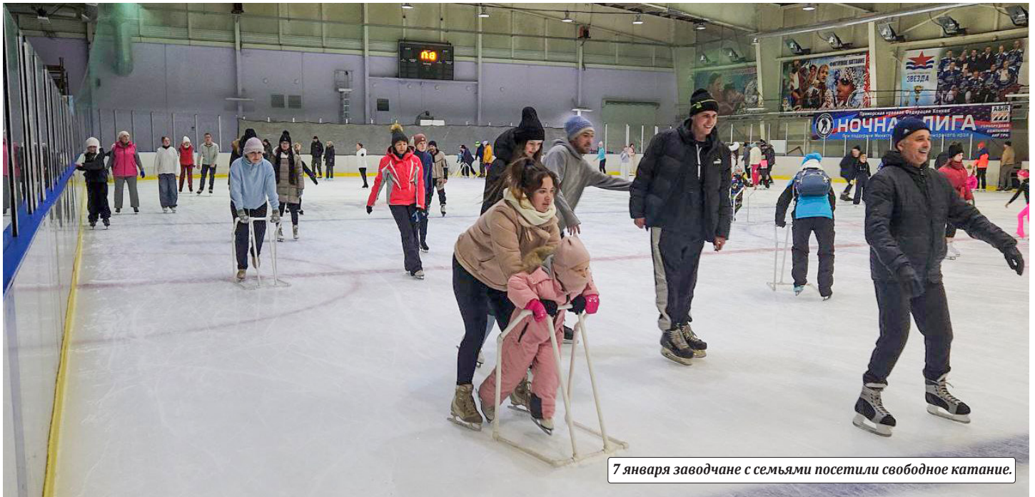
7 января заводчане с семьями посетили свободное катание.