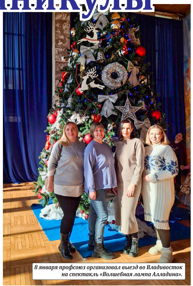
8 января профсоюз организовал выезд во Владивосток на спектакль «Волшебная лампа Алладина».